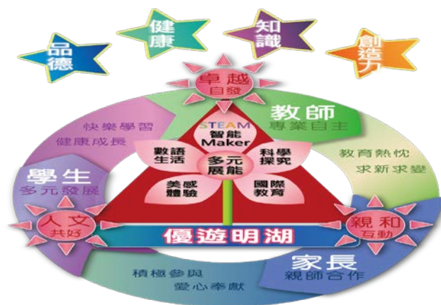
表 6：明湖願景圖像說明