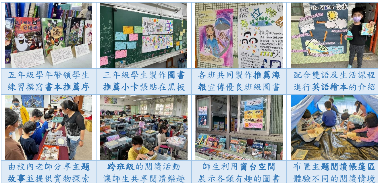
五年級學年帶領學生練習撰寫書本推薦序

配合兒童月「課堂翻轉」活動，本校於每年三月底辦理曬書日，邀請全校師生共同薦書、評書、換書~以書會友，共享讀書樂趣，布置教室空間，將整個校園視為一座巨大的圖書館，讓孩子暢遊在班級閱讀角、故事教室、主題閱讀書屋等空間進行多元閱讀與探索，享受探究知識的樂趣。