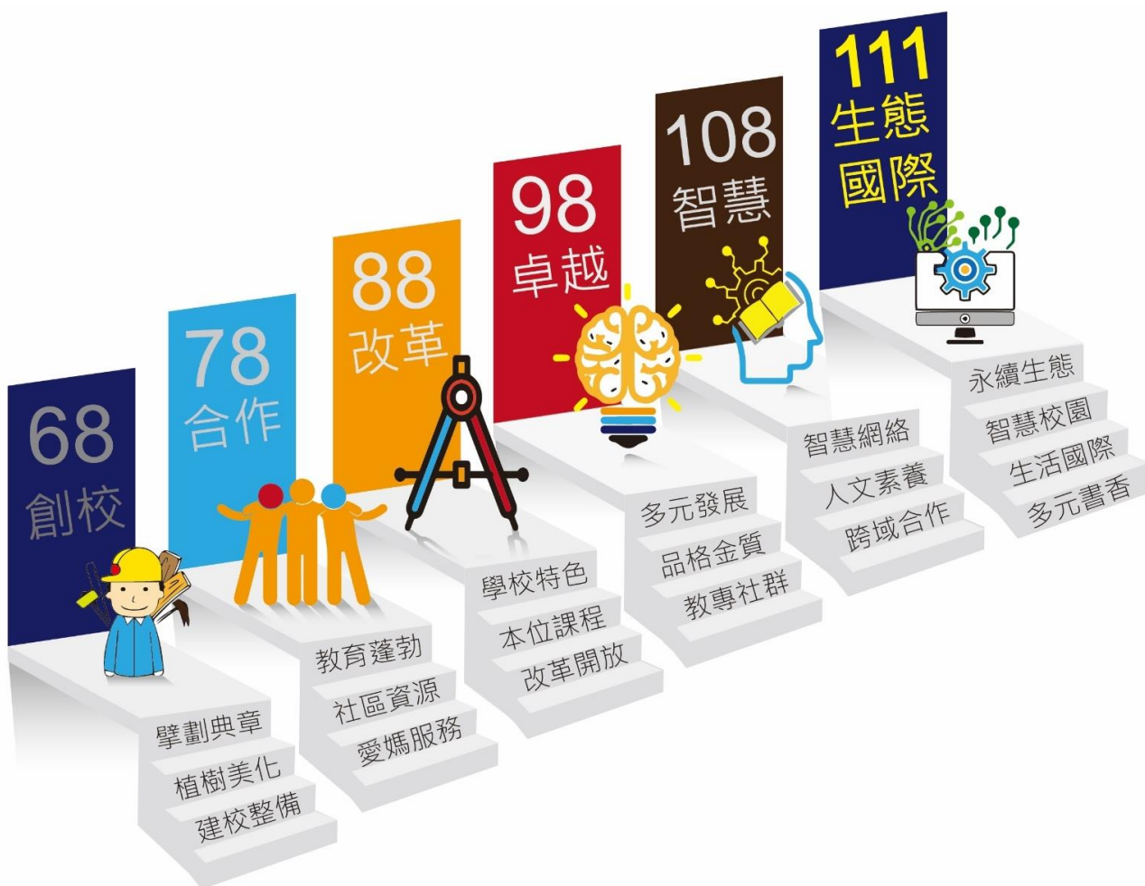
學校簡史暨教育發展沿革簡圖

康寧國小創校至今四十餘載，面對全球化、跨域整合、智慧科技、全人發展等教育思潮的淬鍊，歷經創校、合作、改革與卓越的經營方針，每隔 10 年的耕耘與蛻變，以積累豐沛的教學經驗與策略，用教學為孩子孕育未來的發展契機與信念，重新檢視並衡酌學校內外條件與發展契機，以傳承延續及蛻變創新的精神，體現創新卓越、多元服務及快樂有品的核心價值，進而培養學生自主學習信念，邁向「綠色生態的國際智慧學校」之學校願景。本校重要發展階段如下：