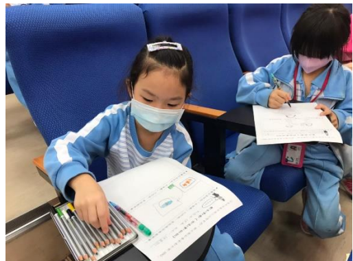
主題書展-低年級導讀活動現場