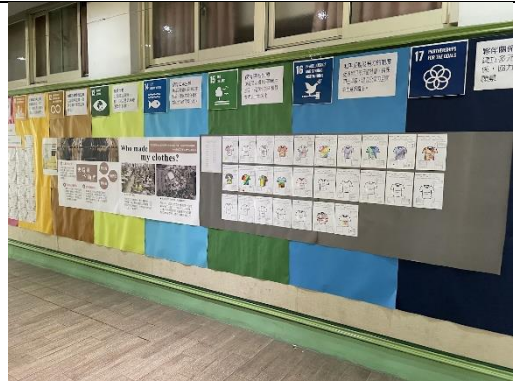
高年級展區：快時尚·不時尚