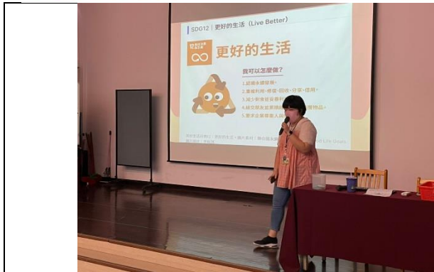
主題書展-中年級導讀活動現場