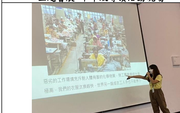
主題書展-高年級導讀活動現場