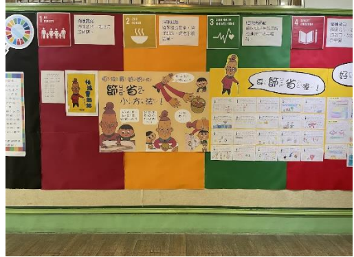
低年級展區：怕浪費奶奶