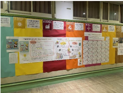
中年級展區：李奧那國王的泰迪熊