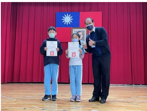
本校學生參與台北市 111 學年度 兒童深耕閱讀自編故事比賽榮獲佳作