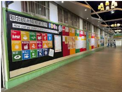
111 學年度校內主題書展：認識 SDGs