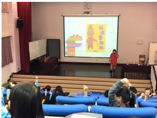
主題書展-低年級導讀活動現場