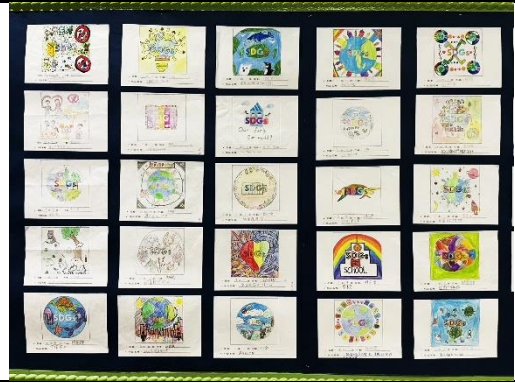
主題書展-SDGs 創意 LOGO 徵稿-獲獎作品