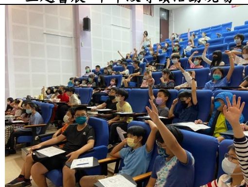
主題書展-高年級導讀活動現場