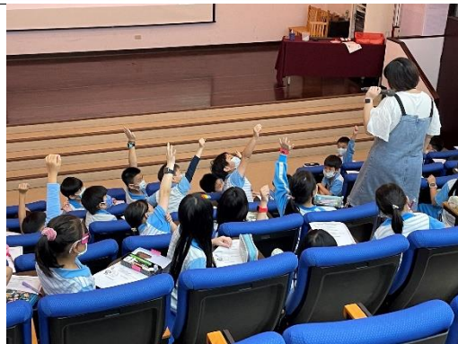
主題書展-中年級導讀活動現場