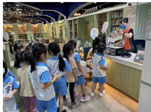
小一認識圖書館活動