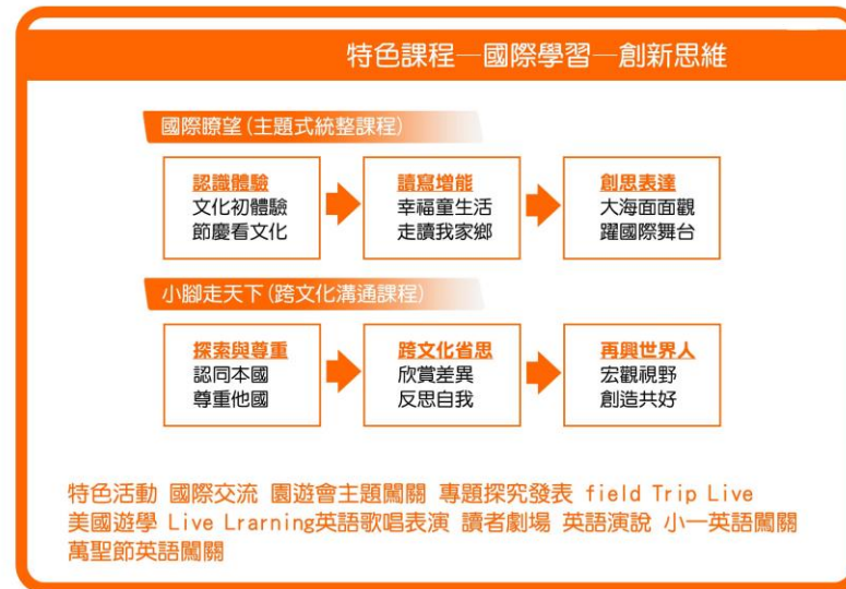
臺北市私立再興小學特色課程和重大活動規劃圖