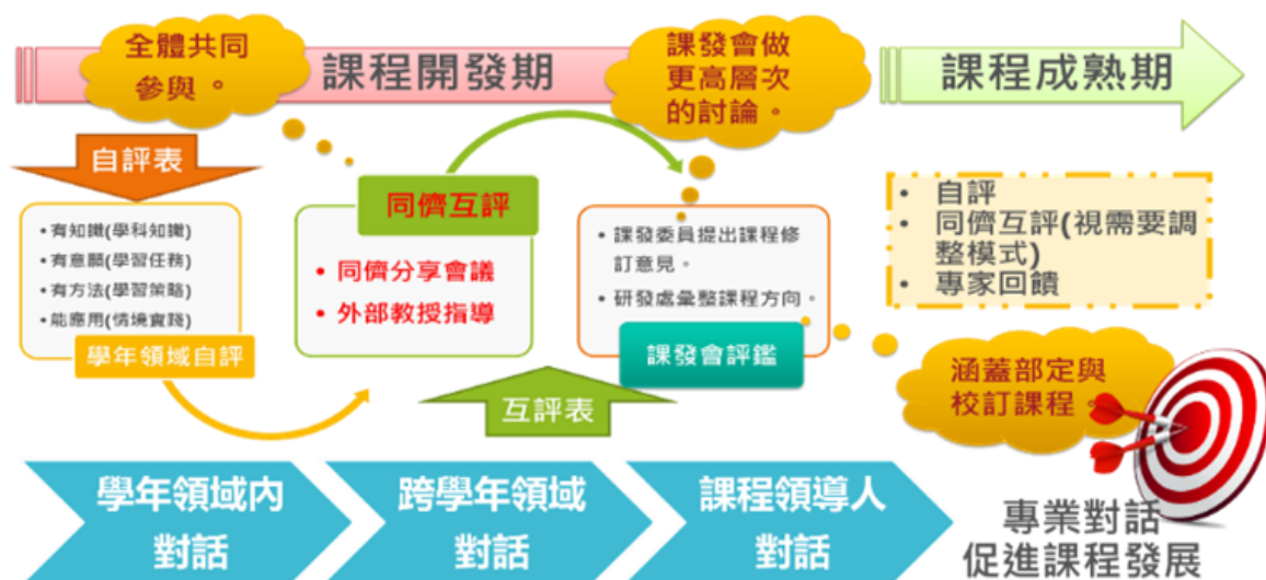
圖 7-7-1 北市大附小課程評鑑模式圖

藉由多元的課程評鑑會議，增進課程設計者與教學者對課程發展與實踐結果的理解，透過專業對話，促進彼此分享，相互欣賞，形成課程發展動力的正向循環。